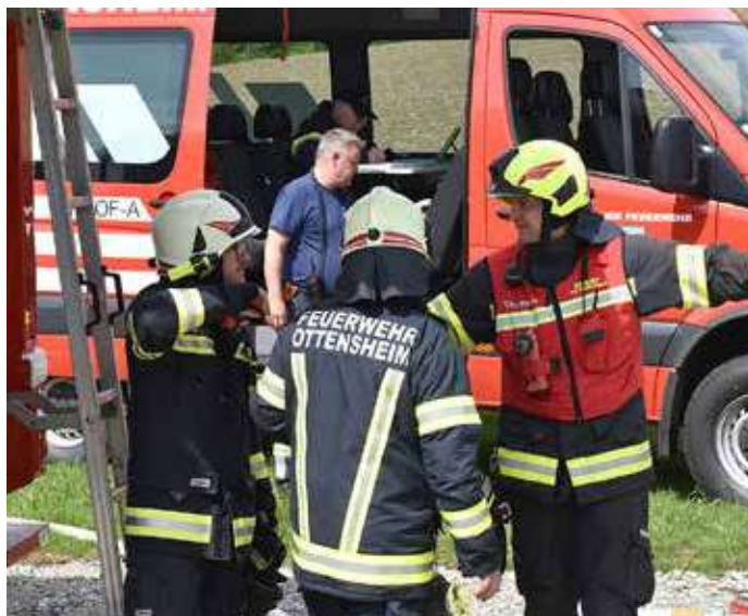
Ohne Absprache funktioniert kein Einsatz, hier besprechen die Kameraden aus Ottensheim und der Koglerau ihr weiteres Vorgehen.