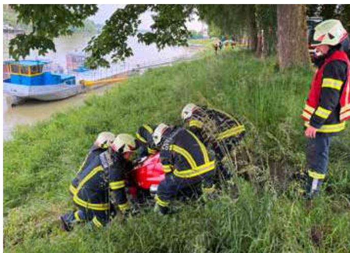
Die Tragkraftspritze FOX muss hier mühevoll zur Donau geschleppt werden um eine gesicherte Löschwasserversorgung herzustellen.

Brandes von Innen. Nachdem die erste vermisste Person dort gefunden und gerettet wurde, beendete der Trupp die Brandbekämpfung in diesem Bereich und kam dem AS-Trupp 2 zur Unterstützung.