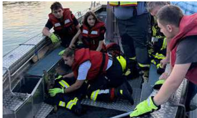
Den Kameradinnen und Kameraden der FF Höflein gelang es das Reh im Kraftwerksbereich zu sich an Bord zu nehmen.