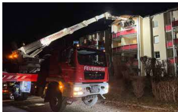
Bei dieser Türöffnung im 3. Stock konnte durch eine offene Balkontüre gewaltfrei eingestiegen werden. Dank der TMB-Walding die zu diesem Einsatz nachalarmiert wurde.

Am 6. März wurden wir um 19.02 Uhr zu einer Türöffnung mit Unfallverdacht gerufen. Zuerst wurde versucht die Wohnungstüre zu öffnen aber weil eine Balkontüre leicht offen war, wurde die TMB Walding (Teleskop-Mast-Bühne) nachalarmiert. Diese wurde positioniert und ein Einsteigen in die Wohnung war ohne Beschädigungen möglich. Leider kam jede Hilfe zu spät, der Bewohner dürfte schon Tage zuvor verstorben sein. Türöffnungen gehören mittlerweile auch zu unseren