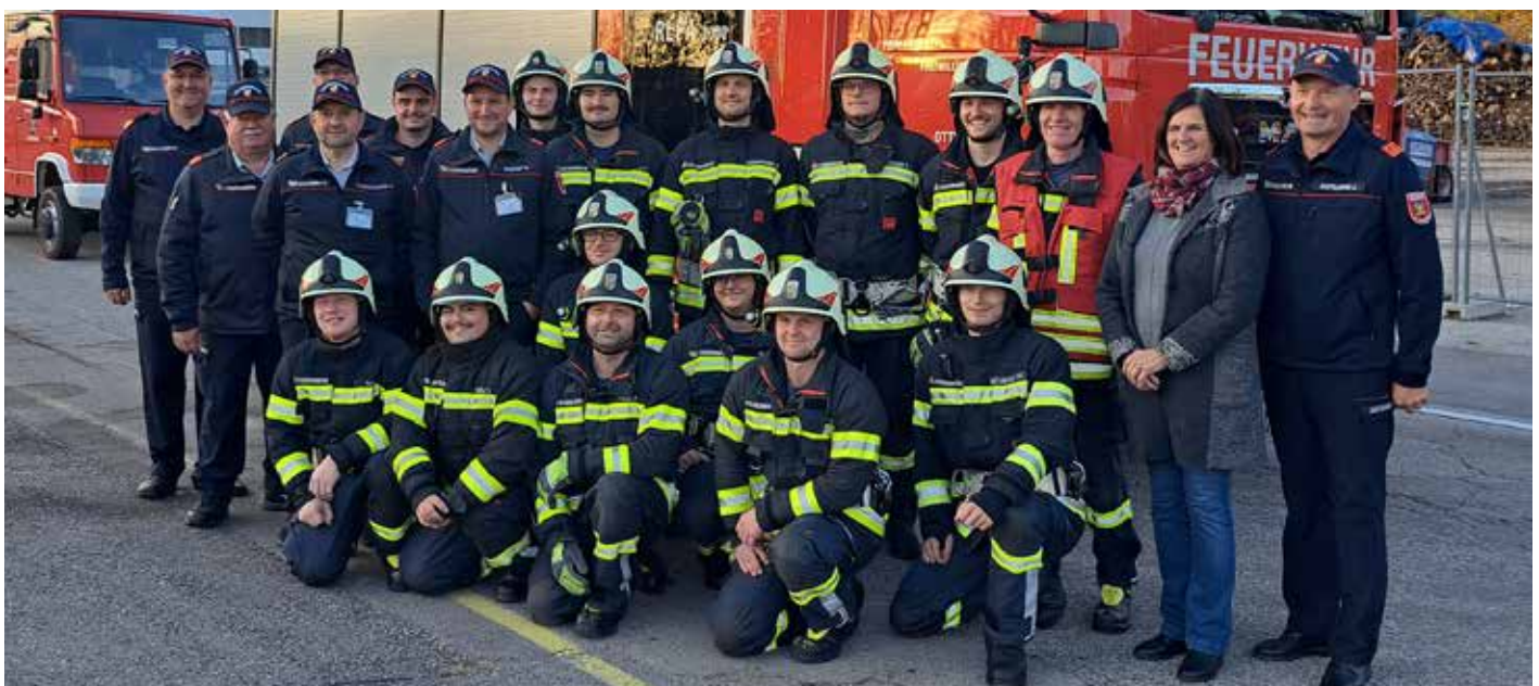
Die Teilnehmer, Bewerter, Abschnittskommandant, Kommandant und Bürgermeisterin nach der erfolgreich Abgelegten Leistungsprüfung welche in beiden Abnahmen mit jeweils 0 Fehlerpunkten abgelegt wurden. Super Leistung, wir gratulieren.