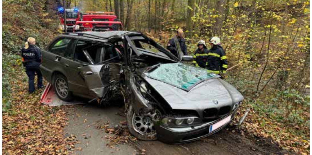
Wenn man die Beschädigungen am Fahrzeug sieht, glaubt man nicht, dass der Fahrer noch ausgestiegen ist um zum nächsten Haus zu gehen.

Ein Fahrzeug dürfte auf Grund überhöhter Geschwindigkeit von der Straße abgekommen sein und ist dann seitlich in einen Baum gekracht. Als wir zur Unfallstelle kamen war die Verwunderung sehr groß, erstens war kein Lenker im und ums Wrack zu finden und wie das passieren konnte war uns unverständlich. Unverzüglich begannen wir, gemeinsam mit der sich vor Ort befindlichen Polizei, die Gegend nach dem Lenker abzusuchen. Der Rest der Mannschaft sicherte die Unfallstelle ab und bereitet die Bergung des Unfallfahrzeugs vor. Nach kurzer Zeit kam die