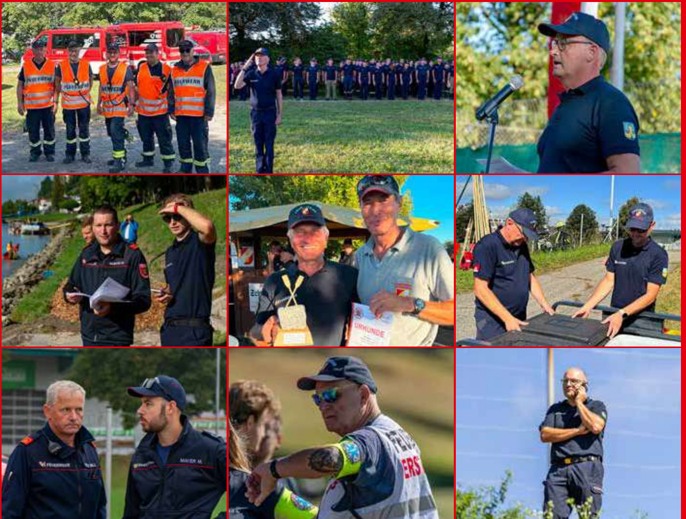
Als Vorbereitung zu dem am 19. und 20. Juni 2026 in Ottensheim stattfindenden Landes-Wasserwehrleistungsbewerb wurde heuer ein Bezirks-Wasserwehrleistungsbewerb bei uns in Ottensheim durchgeführt. Mehr Bilder davon im Bericht.