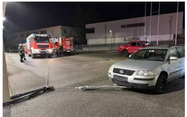
Das Bergen von Fahrzeugen mit der Seilwinde und das Arbeiten mit festen und losen Rollen wird hier in den verschiedensten Arten geübt.