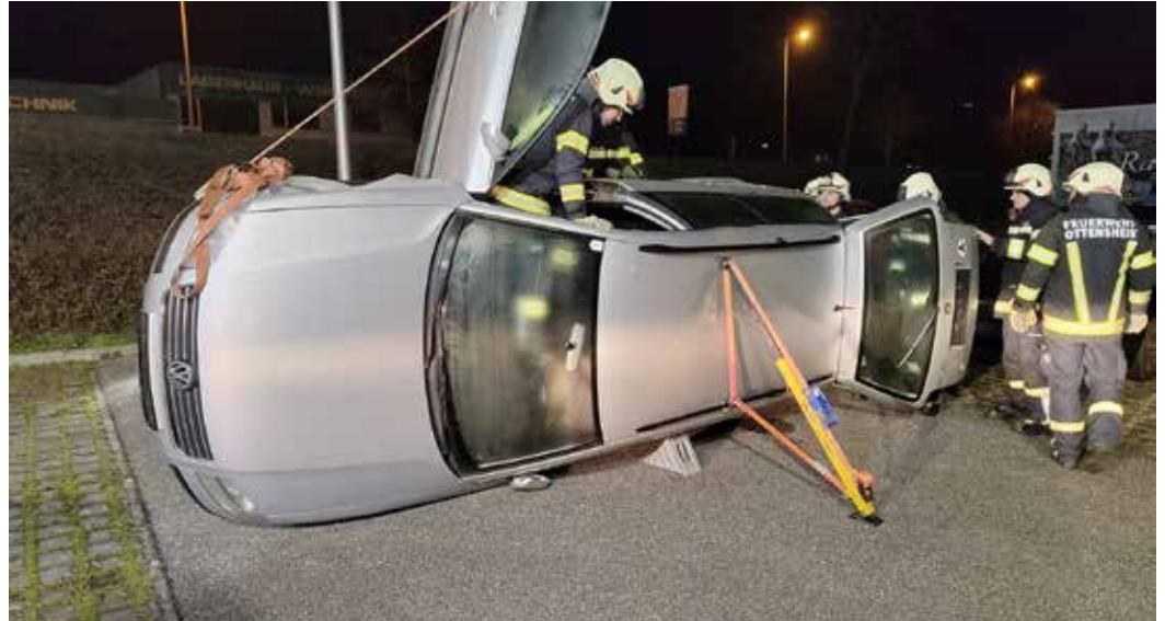
Mit dem Stab-Fast ein auf der Seite liegendes Fahrzeug zu stabilisieren war hier die Aufgabe.

Im Bereich der technischen Hilfeleistung üben wir unter anderem die Personenrettung nach Verkehrsunfällen, das fachgerechte Sichern und Unterbauen von Fahrzeugen, das Heben von Lasten mit Hebekissen, den Einsatz von Seilwinden und Greifzug sowie den sicheren