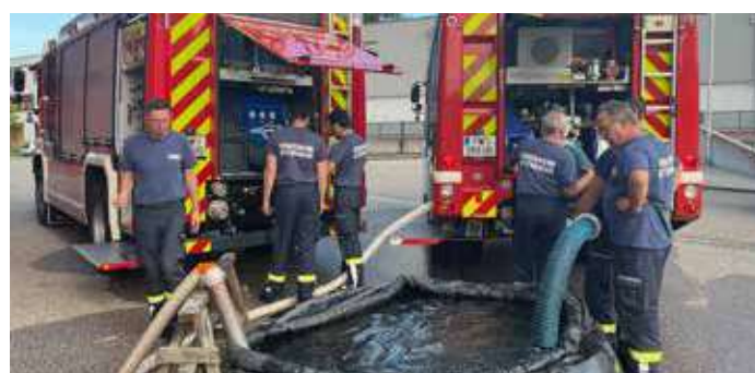
Hier wird das Ansaugen aus einem Pufferspeicher direkt in die Einbaupumpen der Tankwagen geübt.

Im Rahmen der diesjährigen Schulungen haben wir nicht nur das sichere und genaue Steuern unserer Fahrzeuge bei den Langsamfahrübungen, die Verwendung der Straßenwaschanlage sondern auch den Fremdwasserausbetrieb mit der Einbaupumpe des TLF und des RLF geübt.