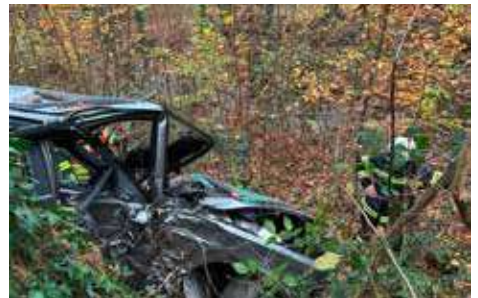
Das Auto sieht eher aus als wäre der Unfall auf einer Autobahn passiert und nicht am Bleicherweg.