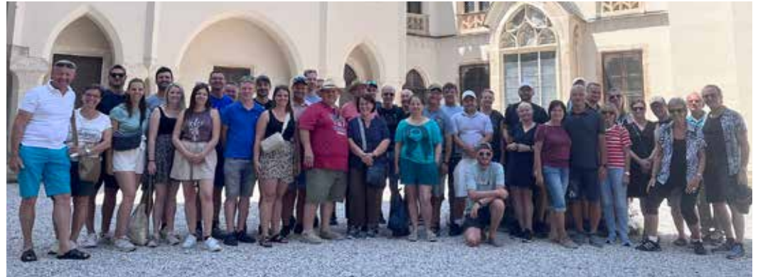
Leider konnten nicht alle dabei sein, aber die dabei waren, machen alle rundum zufriedene Gesichter.

Der Sonntag begann mit einer Fahrt in die slowakische Haupt-