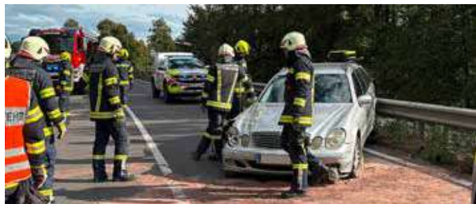
Zum Glück ist an diesem Freitag Nachmittag nicht mehr passiert, eine Verletzte Lenkerin und ausgelaufene Betriebsmittel.

An der Unfallstelle auf der B127 in Puchenu angekommen waren auch schon die Kameraden aus Puchenu, Polizei, Notarzt und Rettung vor Ort. Für uns war außer dem Retten einer am Unfall beteiligten Person aus einem Fahrzeug und Reinigungsarbeiten nicht viel zu machen. Da sowieso sehr viele Einsatzkräfte vor Ort waren und der Unfall sich im Gemeindegebiet von Puchenu befand, wurde der Einsatz an die FF Puchenu übergeben und wir konnten wieder einrücken.