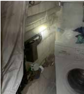
Die Schadstelle war noch vor dem Wasserzähler beim Hausanschluss.

Am 31. Jänner 2025 wurde die Feuerwehr Ottensheim zu einem Wasserschaden in der Stifterstraße gerufen. Dort angekommen stellte sich heraus, dass die Hauptzuleitung zum Gebäude defekt war und da-