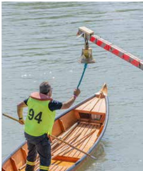
Die Glocke, für viele doch eine große Hürde!