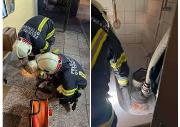
Die Tauchpumpe wird hier für den Einsatz vorbereitet. Mit einem Schlauch wurde das eindringende Wasser direkt bei der Schadstelle abgefangen und in eine Badewanne geleitet. Von dort wurde es mit einer Tauchpumpe nach draußen befördert. Eine Notlösung bis der Hausanschluss abgsperrt wurde.

durch ein massiver Wassereintritt ins Haus stattfand. Bis zum Eintreffen eines Gemeindemitarbeiters wurde versucht das eindringende Wasser mit einem Schlauch in eine Badewanne umzuleiten und anschließend mit einer Tauchpumpe ins Freie zu befördern. Nach dem Eintreffen des Mitarbeiters wurde der Schieber zum Haus geschlossen und so konnte der Wassereintritt gestoppt werden. Die FF Ottensheim rückte mit den Nasssaugern an und versuchte so gut es ging die Wassermassen zu beseitigen. Die Reparatur des Schadens konnte noch in der Nacht durchgeführt werden. Einsatzende war dann um 04.28 Uhr.