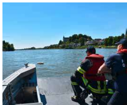
Das Ankern oder eine Boje mit Anker auf der Donau setzen ist immer wieder zu üben genau so wie das Aufnehmen von in der Donau treibenden Gegenständen oder Personen.

Die regelmäßigen Übungen tragen wesentlich zur sicheren Handhabung des Motorboots und zur Vorbereitung auf Einsätze unter realen Bedingungen bei.