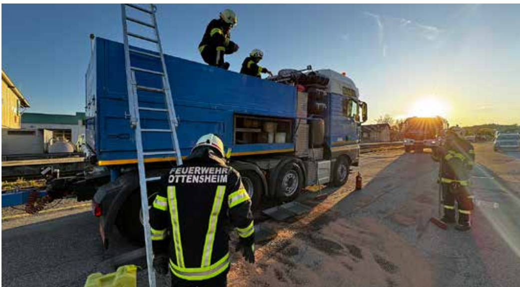
Durch Sonneneinstrahlung und Wärme wurde der Diesel aus dem Zusatztank gedrückt und musste aufgefangen und abgepumpt werden.

stand leicht schräg und die Sonne schien direkt auf den Zusatztank. Dadurch erwärmte sich der Diesel und die Luft im Inneren so sehr, dass es die Flüssigkeit über den Tankdeckel und die Entlüftung drückte und über die Ladefläche auf die Fahrbahn floss. Ölbindemittel