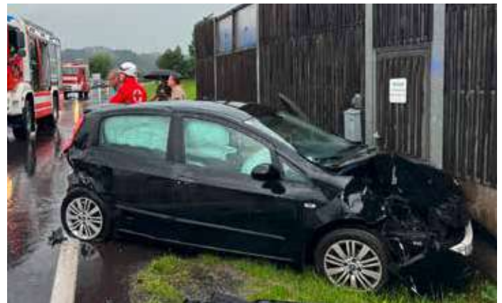
4 zum Teil ziemlich kaputte Fahrzeuge und einige Verletzte forderte dieser Unfall bei der Kreuzung B127 zur B131 weil ein Fahrzeuglenker die wartenden Autos bei der Ampel zu spät erkannte.