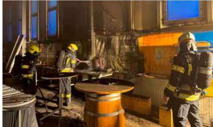
Das Feuer dürfte auf Grund von Sauerstoffmangel erstickt sein. Es waren nur kleine Nachlöscharbeiten notwendig.

Am 9. April um 05.47 Uhr, wurden wir von der FF Ottensheim gemeinsam mit der FF Höflein und der FF Walding zu einem Brand im Gewerbegebiet Ottensheim alarmiert. Ein Mitarbeiter der zu dieser Zeit zur Arbeit kam, erkannte die massive Rauchentwicklung im Gebäude und alarmierte die Einsatzkräfte. Den anrückenden Feuerwehren zeigte sich auch nur diese Rauchentwicklung und ein kleiner Schwelbrand. Glücklicherweise ist dem Brand im wahrsten Sinne die Luft aus-