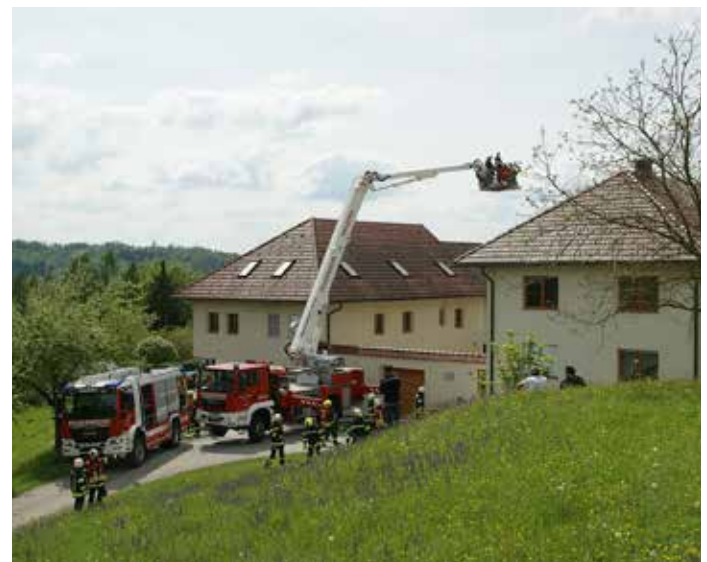
Eine gesicherte Löschwasserversorgung musste auch zur TMB-Walding aufgebaut werden um diese effektiv einsetzen zu können.