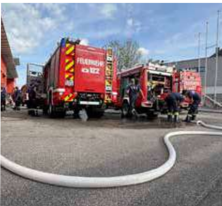
Zu einer Übung gehört natürlich auch das Aufräumen. Nach dem Aufräumen und der Schlussbesprechung muss auch die Kameradschaft gepflegt werden. Abschließend beim Feuerwehrhaus eingetroffen, wird die Einsatzbereitschaft mit Reinigung und Auffüllen wieder hergestellt.