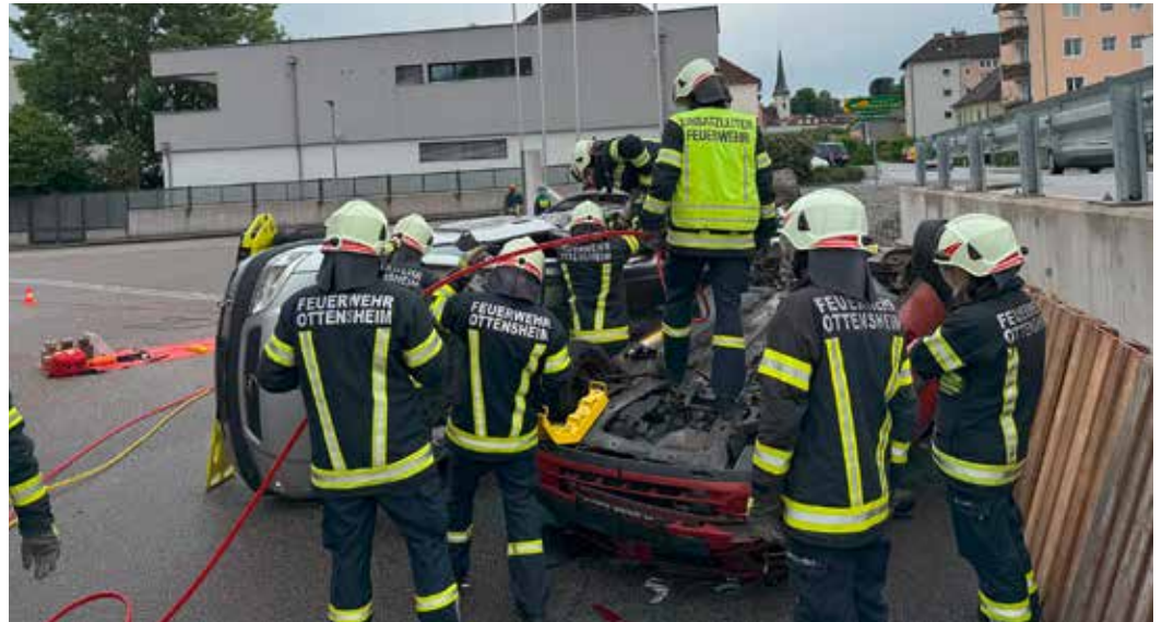
Der Einsatzleiter mitten im Geschehen um seine Kameradinnen und Kameraden bestmöglich zu koordinieren.

Im Mittelpunkt stand dabei die „Golden Hour of Shock“ - die