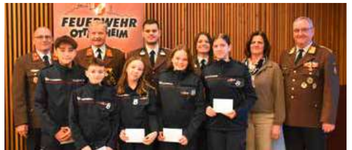
Auch bei der Jugend standen Angelobungen und zahlreiche Beförderungen am Programm, ein Zeichen der jeweiligen Ausbildungsstände.