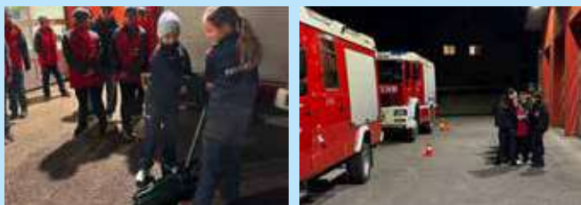
Links: Auch die Mädels packen kräftig mit an! Rechts: In zweier Teams mussten die Kids eine Unfallstelle absichern.

Zudem wurde das richtige Absichern einer Unfallstelle gemeinsam in der Theorie erarbeitet und anschließend in gemeinsamer Vorbereitung auf das Feuerwehrjugendleistungsabzeichen in Gold gleich ausprobiert.