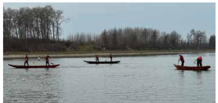
Hier wird am Altarm in "sicherer Umgebung" das Rudern und Steuern der Zillen von den Teilnehmern geübt.