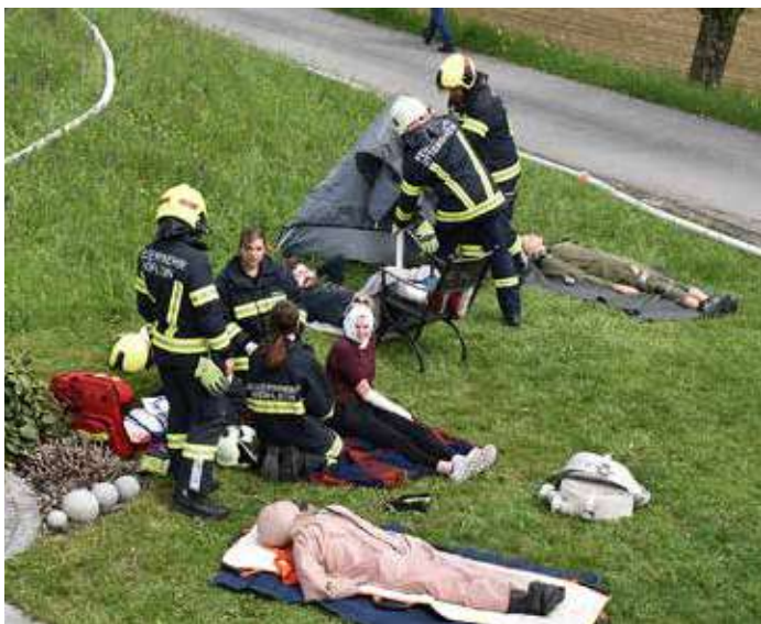
Auch eine Sammelstelle für die verletzten Personen wurde eingerichtet um diese dann an den Rettungsdienst übergeben zu können.

Besonders hervorzuheben ist die hervorragende Zusammenarbeit der vier Feuerwehren, die mit gut abgestimmten Abläufen und klarer Kommunikation zur erfolgreichen Durchführung der Übung beitrugen.