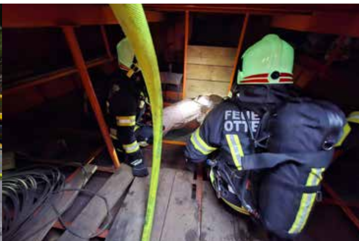
Mit all der Ausrüstung in eine kleine Schiffsluke klettern und dann im Inneren noch Verletzte suchen und retten ist eine herausfordernde Aufgabe.