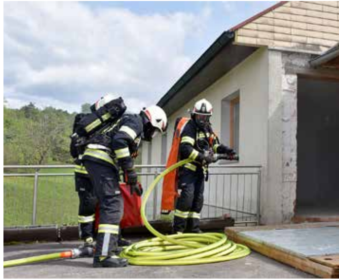
Einer der eingesetzten Atemschutztrupps richtet sich die Schlauchreserve um sogleich mit dem Innenangriff zu starten.

Parallel dazu galt es, vier vermisste Personen aus dem brennenden Gebäude zu retten.