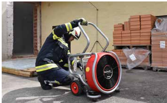
Hier wird der Hochleistungslüfter vorbereitet um nach Freigabe das Brandobjekt wieder rauchfrei zu machen.

Hydranten aufgebaut. Einsatzabschnittsleitung wird durchgeführt.