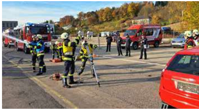
Der Rettungseinsatz ist im Aufbau. Die Unfallstelle ist abgesichert, Wasser ist schon am HD-Rohr, die Beleuchtung wird aufgebaut und der Rettungstrupp bereitet sich auf den Einsatz vor.

Eine Gruppe besteht aus einem Gruppenkommandanten, einem Melder, zwei Maschinisten, einem Rettungstrupp, einem Sicherungstrupp und einem Gerätetrupp. Die gestellten Aufgaben sind auf die einzelnen Personen und Trupps aufgeteilt. Der Gruppenkommandant führt die Gruppe durch den Einsatz und gibt die Befehle. Der Melder rüstet sich mit dem Funkgerät und der Ersthelfer Ausrüstung aus um anschließend die Verletztenbetreuung durchzuführen. Der Maschinist 1 (MA 1) ist Kraftfahrer des Rüstlöschfahrzeugs (RLFA), sorgt für den Strom und bedient unter anderem die Pumpe um das Wasser zum Strahlrohr zu bringen. Der Maschinist 2 (MA 2) ist Kraftfahrer des Löschfahrzeugs (LF-A) und bedient das hydraulische Rettungsgerät.