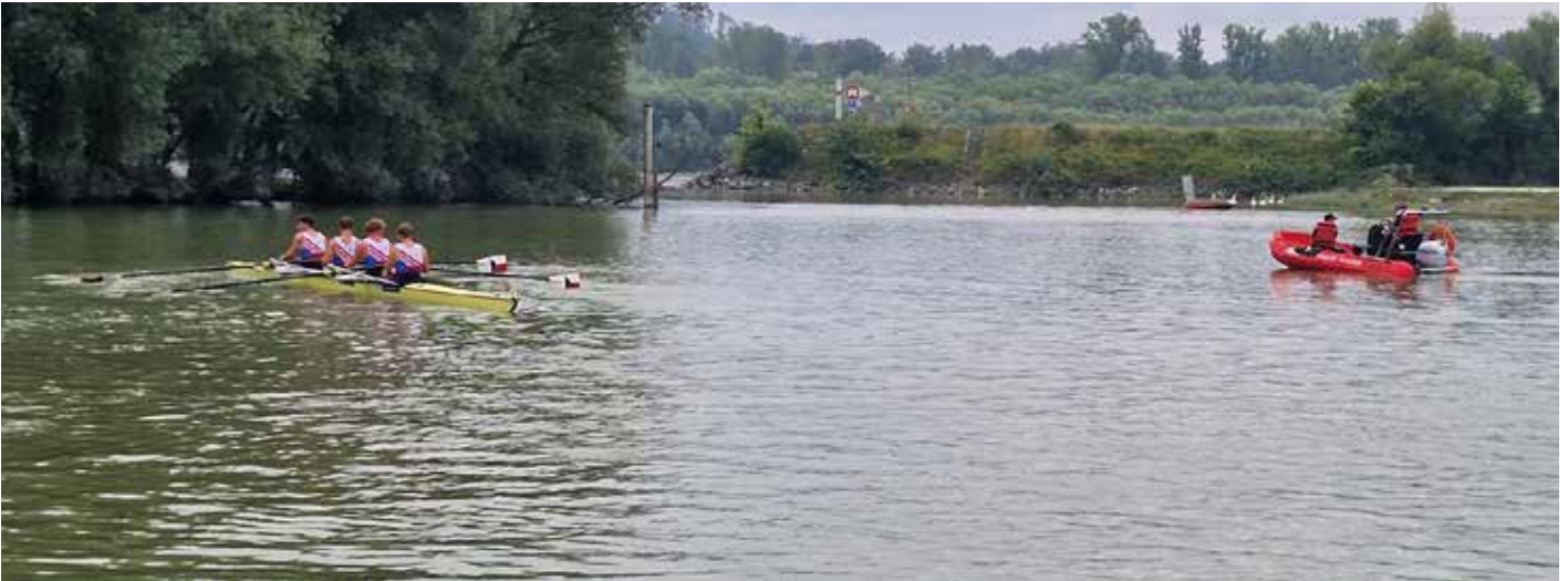
Im Zielbereich war ein kleines wendiges Rettungsboot der FF Alkoven im Einsatz.