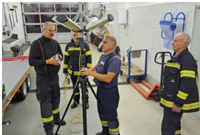
Hier wird die externe Beleuchtungseinheit aufgebaut und getestet.

Begonnen wurde im Jänner mit dem Durchbesprechen und Arbeiten mit den Einsatzordnern,