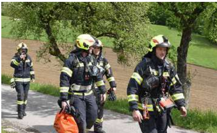
Die Kameraden der FF Koglerau, ausgerüstet mit dem schwerem Atemschutz, am Weg zum Einsatzort.