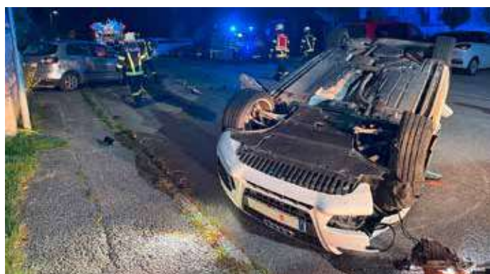
Das sich bei einem Verkehrsunfall im Ortsgebiet ein Fahrzeug überschlägt passiert eher selten, Hauptsache es ist niemand verletzt worden.

In der darauffolgenden Nacht ereignetet sich ein weiterer Verkehrsunfall, diesmal im Gemeindegebiet von Ottensheim. In den frühen Morgenstunden des 27. September krachte ein Autofahrer in ein am Straßenrand parkendes Auto, wobei sich das Fahrzeug überschlug und auf dem Dach liegen blieb. Das geparkte Auto wurde auf den Gehsteig geschleudert. Bei unserem Eintreffen war der Lenker nicht mehr im Fahrzeug. Unsere Arbeiten waren das Binden von ausgelaufenen Betriebsmitteln, das am Dach liegende Auto wurde wieder auf die Räder gestellt, das Fahrzeug am Gehsteig wurde von dort entfernt und die Unfallstelle gereinigt. Nach dem Abtransport des Unfallfahrzeugs durch eine beauftragte Firma, konnten wir wieder ins Feuerwehrhaus einrücken.