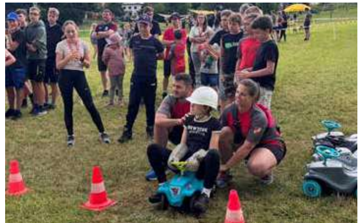
Beim Bobby Car Rennen mussten auch die Betreuer Hand anlegen.