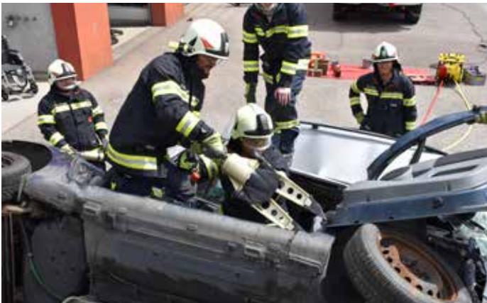
Arbeiten mit dem Spreizer von oben ist äußerst Kräfteaufwendend. Rund 20kg schwer und mit einer Spreizkraft bis zu 33 Tonnen.

Solche Übungen sind ein wesentlicher Bestandteil der Ausbildung in der Feuerwehr Ottensheim um für den Ernstfall bestmöglich gerüstet zu sein.