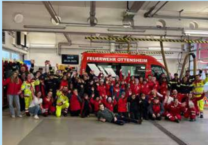
Die Jugendgruppe der FF Ottensheim, das JRK Walding und alle Helferinnen und Helfer.

Die Übung war in sechs Stationen unterteilt – drei davon wurden von der Feuerwehr gestaltet, drei vom Roten Kreuz. Die Jugendlichen konnten dabei vielfältige Erfahrungen sammeln: Bei der Feuerwehr standen Themen wie die Handhabung eines Feuerlöschers,