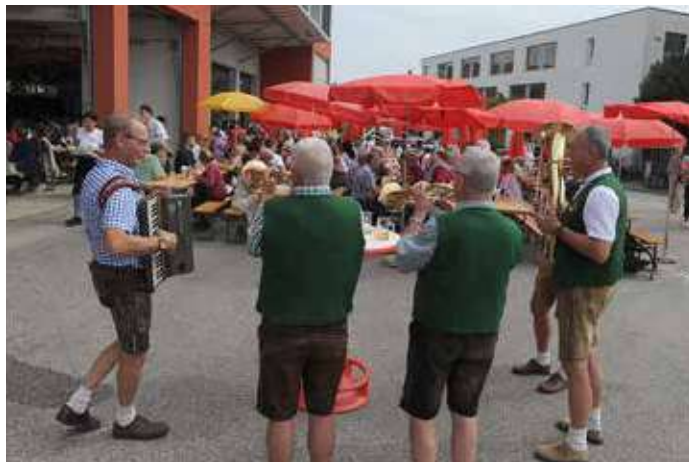
Ein Fest für die Familien. Wie alle Jahre eine tolle Stimmung bei unseren Gästen und der ganzen „Mannschaft“- DANKE!

Für das leibliche Wohl war bestens gesorgt: Von Schnitzeln und Bratwürsten über die beliebte Kistensau bis hin zu einer Portion Pommes – die Auswahl ließ keine Wünsche offen. Erfrischende Getränke sorgten an diesem Tag für willkommene Abkühlung. Nach dem Mittagssmahl lud ein großes Kuchenbuffet mit zahlreichen süßen Köstlichkeiten zum Verweilen ein, und viele nutzten die Gele-