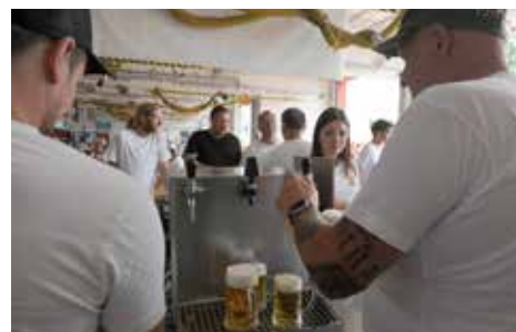
Hier nur einige Eindrücke rund um unser Fest und einigen der helfenden Hände.