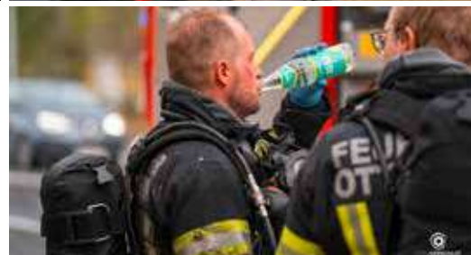
Einige Eindrücke vom Brandeinsatz in der Bahnhofstraße, dank dem koordiniertem Einsatz der Feuerwehren Ottensheim, Höflein und Walding konnte eine Ausbreitung verhindert werden.

ten den Vollwärmeschutz sowie den Dachbereich. Dieses koordinierte Vorgehen führte zu einem raschen Einsatzerfolg und der Brand konnte auf die 3 Zimmer der Wohnung begrenzt werden. 2 Katzen wurden aus einer