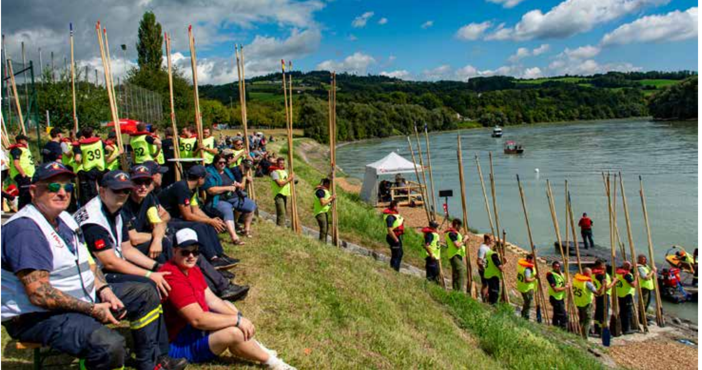
Am Vortag noch Regen aber pünktlich zum Bewerb hatten Zillenfahrer und Besucher doch eine recht angenehme Witterung.