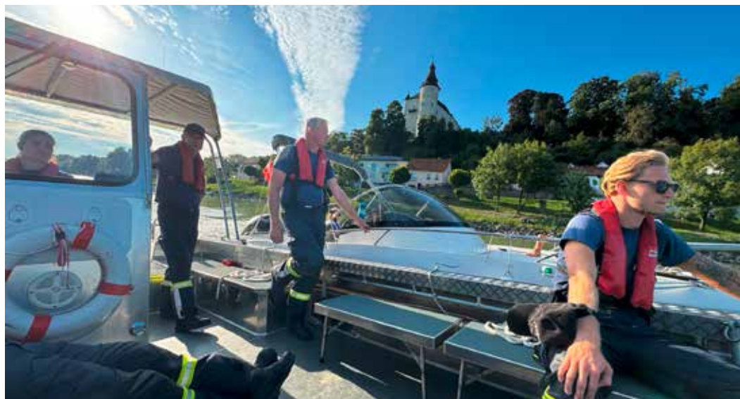
Das havarierte Boot wurde seitlich an unserem A-Boot verheftet und so gemächlich nach Linz in den Winterhafen geschippert, wo es auf einen Trailer verladen und in eine Fachwerkstatt gebracht wurde.

Auch eine Reparatur kam nicht in Frage, weil laut Werkstatt erst der passende Ersatzteil bestellt werden musste. Das Motorboot war an der Kaimauer im Oberwasser des Kraftwerks Ottensheim-Wilhering verheftet. Einige Feuerwehrleute waren nach den Aufräumarbeiten von unserem Fest noch im Feuerwehrhaus und so ging alles relativ schnell. Das A-Boot wurde im Feuerwehrhaus zur Abfahrt fertig gemacht, mit der Schleusenaufsicht wurde Kontakt aufgenommen und schon ging los zur Slipstelle am Altarm. In der Zwischenzeit wurde für uns die rechte Schleusenkammer bereit gestellt. Es dauerte nicht lange und wir konnten das fahr-