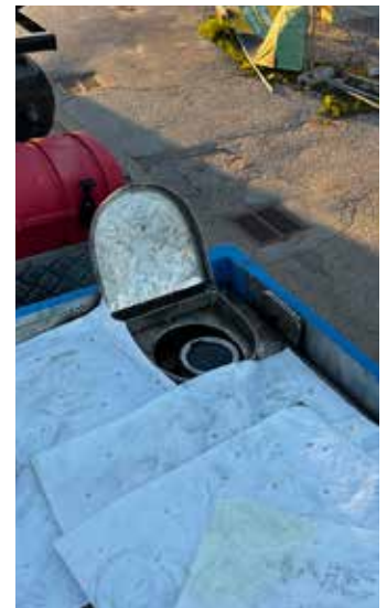
Mit Ölbindemittel wurde der Bereich der Einfüllöffnung abgedeckt.

wurde großflächig am Boden aufgebracht, Ölbindemittel wurde am Fahrzeug ausgelegt und rund 80 Liter Diesel mussten abgepumpt werden um die Gefahr zu beseitigen. Mannschaft und Fahrzeuge konnten um 20.25 Uhr den Einsatz beenden und wieder einrücken.