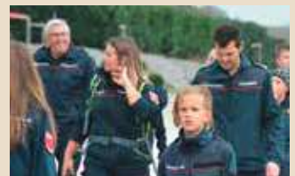
Im Austausch mit anderen Jugendbetreuern.

Die Route führte gut 10 Kilometer rund um das Gemeindegebiet von Neußerling und bot den Jugendlichen und auch den Betreuern die Möglichkeit, sich untereinander auszutauschen und neue Kontakte zu knüpfen.