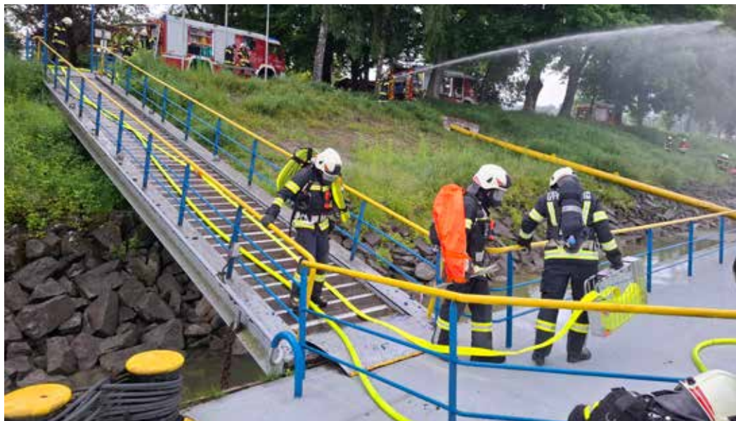
Ein angereicherter Einsatz am Schiff ist immer etwas Besonderes. Es darf einem da kein Fehltritt passieren sonst wird es für die Feuerwehrleute äußerst gefährlich.

Der AS-Trupp 1 begab sich in den hinteren Bereich des Standschiffes, drang in den Mannschaftsraum ein und begann mit dem Löschen des