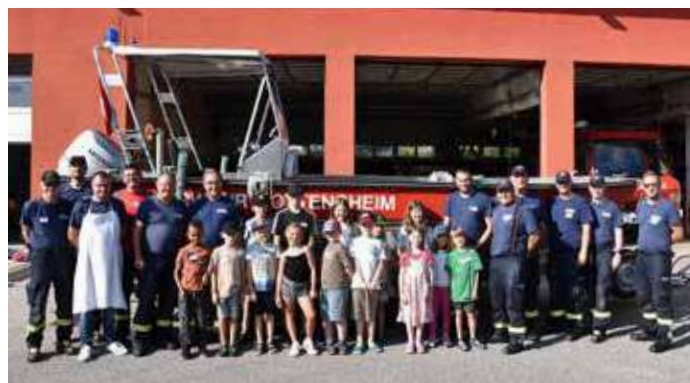
Die Kinder und Betreuer vor dem A-Boot. Eine Ausfahrt mit diesem Boot ist alle Jahre wieder ein Höhepunkt.

welches mit dem hydraulischen Rettungsgerät und einer Zahnstangenwinde gesteuert wurde. Außerdem durften die Kinder bei einer Rundfahrt mit unserem Löschfahrzeug mitfahren und den Umgang mit unterschiedlichen wasserführenden