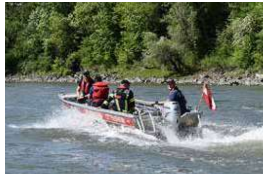
Das „Wassern“ der Motorboote gehört zu einer Übung der Schiffsführer ebenso wie eine rasante Fahrt mit dem FRB (Feuerwehr Rettungsboot) und anschließenden Manövern.

Die Übung im August widmete sich speziell dem Setzen von Anker und Bojen, da Anfang September der Bezirks- und im Juni 2026 der Landes-Wasserwehrleistungsbewerb in Ottensheim stattfindet. Hierfür müssen Bojen für den Streckenverlauf gesetzt werden, dies wurde an diesem Übungstag besonders trainiert.