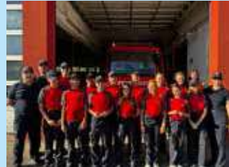
Links: Trainierte und routinierte Handgriffe werden auch bei den Bewerbungen angewendet. Rechts: Nach der Übergabe der erreichten Abzeichen.

berg). Bereits beim ersten von drei Abschnittsbewerben zeigten die Jugendlichen ihr Können und konnten erste tolle Ergebnisse erzielen.