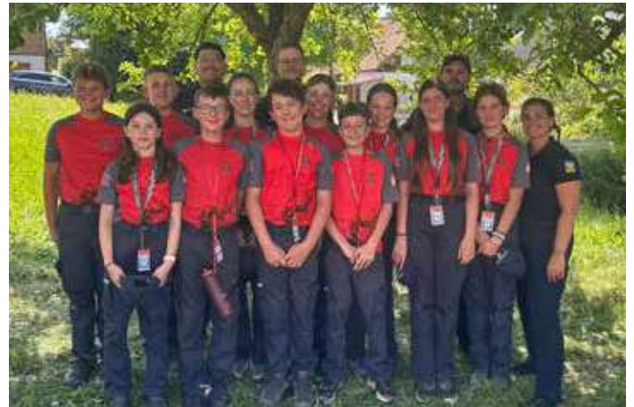
Die Jugend mit dem Betreuer team bei einem Gruppenbild.

Das Jugendlager bot nicht nur Action und Unterhaltung, sondern stärkte vor allem den Zusammenhalt unter den Jugendlichen – und auch zwischen den Betreuern.