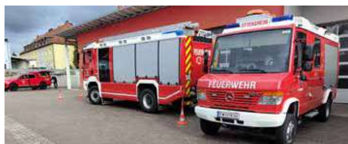
Langsamfahrübungen wie das Einparken gehören auch immer wieder zum Schulungsprogramm.

Neben den Übungen sind auch die regelmäßigen Kraftfahrerschulungen ein wichtiger Bestandteil im Jahresplan der FF Ottensheim. Ziel ist es dabei, den sicheren Umgang mit den Einsatzfahrzeugen sowie deren Technik zu verbessern und somit die Sicherheit im Einsatzfall zu erhöhen.