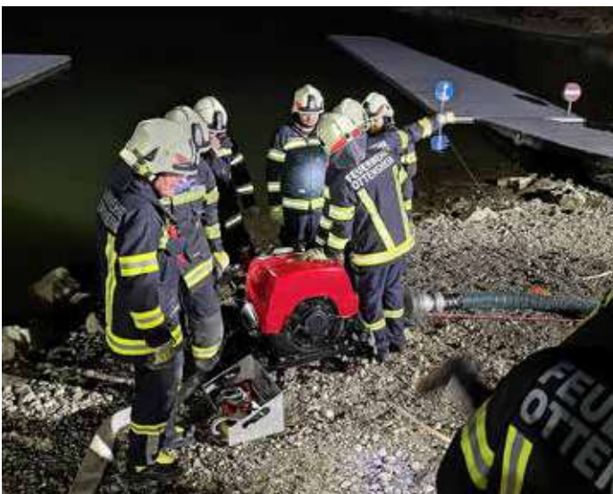
Auch das Arbeiten mit der Tragkraftspritze FOX wird bei den Gruppenübungen immer wieder geübt.