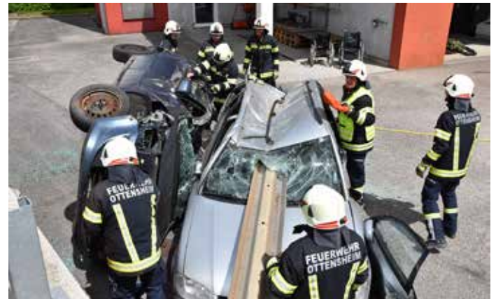
Bei solchen Übungen werden nicht alltägliche Szenarien geübt, um den Horizont der anzuwendenden Möglichkeiten zu erweitern.