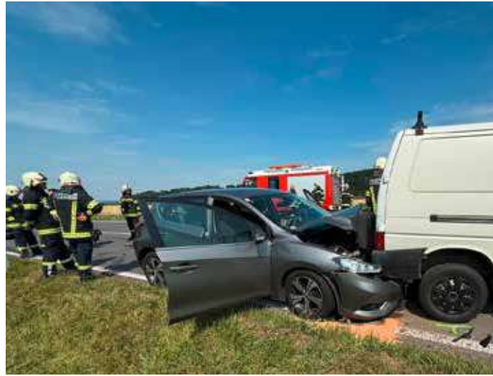
Weil die Ortsangaben bei der Alarmierung nicht klar waren, wurde die FF Ottensheim zu diesem Einsatz auf die B131 gerufen welcher in weiterer Folge an die FF Walding übergeben wurde.

So am 12. Jänner wo es bei Schneeglätte kleinere Ausrutscher ohne Personenschaden gab. Ein weiterer Auffahrunfall ereignete sich am 6. Juli auf der B131 im Gemeindegebiet von Walding. Da die Angaben zum Unfallort ungenau waren wurden wir alarmiert konnten den Einsatz dann aber an die zuständige Feuerwehr Walding übergeben und einrücken.