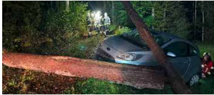
Ein durchaus anspruchsvolles Übungsszenario bot sich den Teilnehmern.

Übungsannahme war ein Verkehrsunfall auf einer Forststraße, bei dem ein PKW durch einen umgestürzten Baum von der Fahrbahn gedrängt wurde. Dabei wurden zwei Personen eingeklemmt.