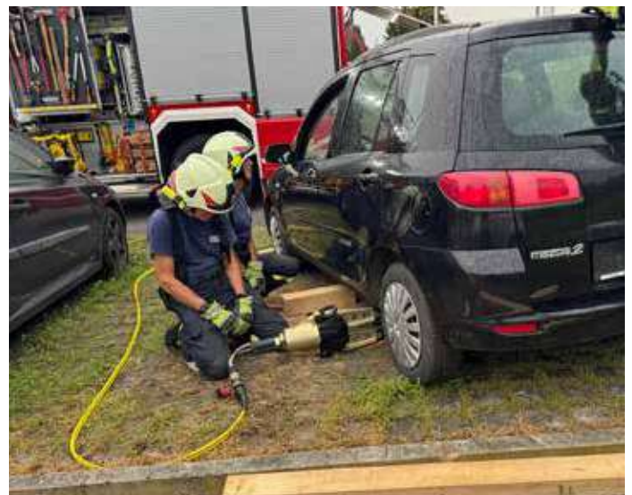
Hier wird ein Fahrzeug mit dem Spreizer schnell aufgehoben um es mit Holzkantern zu stabilisieren.

Umgang mit der Motorsäge. Im Gegensatz zu Einsatzübungen, bei denen es um Zeit und Koordination unter realistischen Bedingungen geht, liegt der Fokus bei Gruppenübungen auf einem ruhigen, strukturierten Vorgehen. Hier steht das Lernen im Vordergrund – neue Techniken können ausprobiert, bestehende Kenntnisse vertieft und der Umgang mit Geräten intensiv geschult werden. Diese Art der Ausbildung fördert nicht nur das technische Können, sondern stärkt auch das Vertrauen in unsere Ausrüstung.