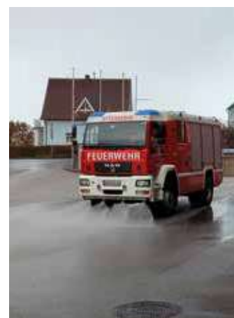
Das Fahren und Arbeiten mit der Straßenwaschanlage muss immer wieder geübt werden. Hier wird gleich mal der Vorplatz beim Feuerwehrhaus gereinigt.

Auch die Gerätekunde kommt dabei nicht zu kurz und so werden bei diesen Schulungen auch die motorbetriebenen Geräte betübt und besprochen.