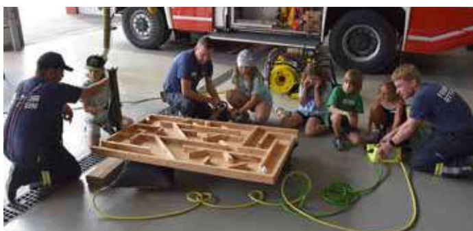
Mit Hilfe von Hebekissen, Spreizer und Zahnstangenwinde die Kugel durchs Labyrinth zu bringen erfordert schon etwas Geschick.

An verschiedenen Stationen konnten die jungen Besucherinnen und Besucher selbst aktiv werden. Besonders viel Geschick war beim Bedienen eines kniffligen Labyrinths gefragt,