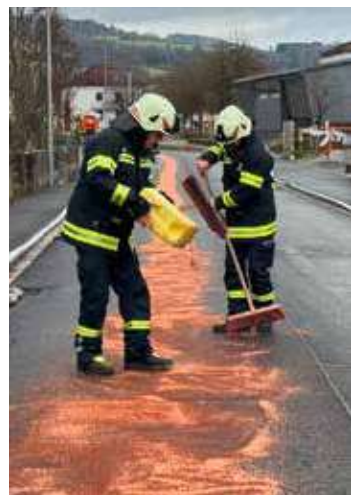
Beim Beseitigen einer Ölspur ist immer viel Handarbeit nötig. Zum Glück gibt es in unserer Gemeinde die Fa. Günter Hartl die uns bei längeren Ölspuren mit den Kehrmaschinen schon mal aushilft.