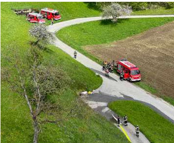
Der Pumpenstandort beim Löschteich und das Atemschutzfahrzeug befanden sich etwas abseits der Einsatzstelle.

Absichern und Stellen von Lotsen wenn erforderlich auf der Straße. AS-Trupp wird gestellt. Nur eine Zubringerleitung zu RLF Ottensheim wird vom